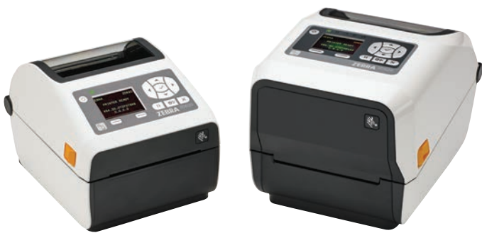
ZD620d-HC con LCD

Como proveedor de atención sanitaria, usted debe facilitar a los profesionales las herramientas que necesitan para dispensar la mejor atención a los pacientes en todo momento. La ZD620-HC de Zebra supera a las impresoras de sobremesa convencionales por su calidad de impresión premium y sus funciones de tecnología punta. Disponible en modelos de impresión térmica directa y de transferencia térmica, la ZD620-HC ofrece de serie las mismas funciones estándar que cualquier impresora de sobremesa de Zebra, además de una interfaz de usuario opcional con LCD en color y 10 botones que simplifica la configuración y la comprobación del estado de la impresora. Como modelo diseñado para atención sanitaria, la ZD620-HC es apta para desinfección constante y ofrece una fuente de alimentación que cumple las normas del sector. Gracias a su impresión opcional a 300 ppp, incluso las etiquetas más pequeñas resultan legibles y nítidas. La ZD620 ejecuta Link-OS® y cuenta con el respaldo de nuestro potente paquete de aplicaciones, utilidades y herramientas para desarrolladores Print DNA, que proporcionan una experiencia de impresión superior mediante un rendimiento más alto, una gestión remota más simple y una integración más sencilla. ZD620 de Zebra: ofrece la velocidad y calidad de impresión y la facilidad de gestión de impresoras necesarias para mejorar la productividad, la precisión y la calidad de los cuidados.